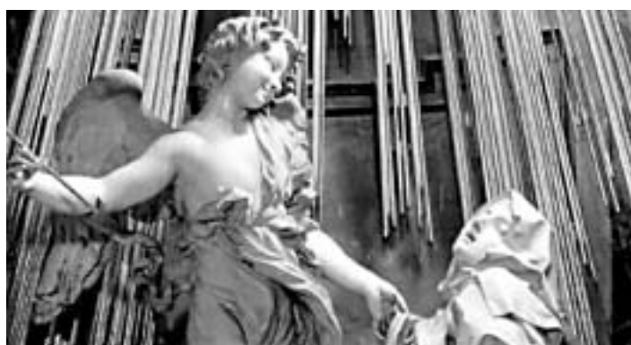
El éxtasis de Santa Teresa de Bernini

no desvirtuar su integridad, principalmente porque la versión original está escrita en castellano antiguo, el cual puede ser un estilo de difícil lectura.