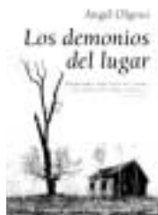
Título: 'Los demonios del lugar' Autor: Ángel Olgoso. Editorial: Almuzara.

Comencé entonces una campaña pro Olgoso entre mis conocidos, como el que descubre un nuevo talento y le urge la necesidad de contarlos antes de que la evidencia de la calidad lo haga visible al resto de mortales. En ello estaba, cuando en la lluviosa e inolvidable tarde del dos de noviembre del año pasado, acudí a la Casa de la Cultura de Maracena donde se fallaba el primer Certamen del Premio internacional de terror Villa de Ma-