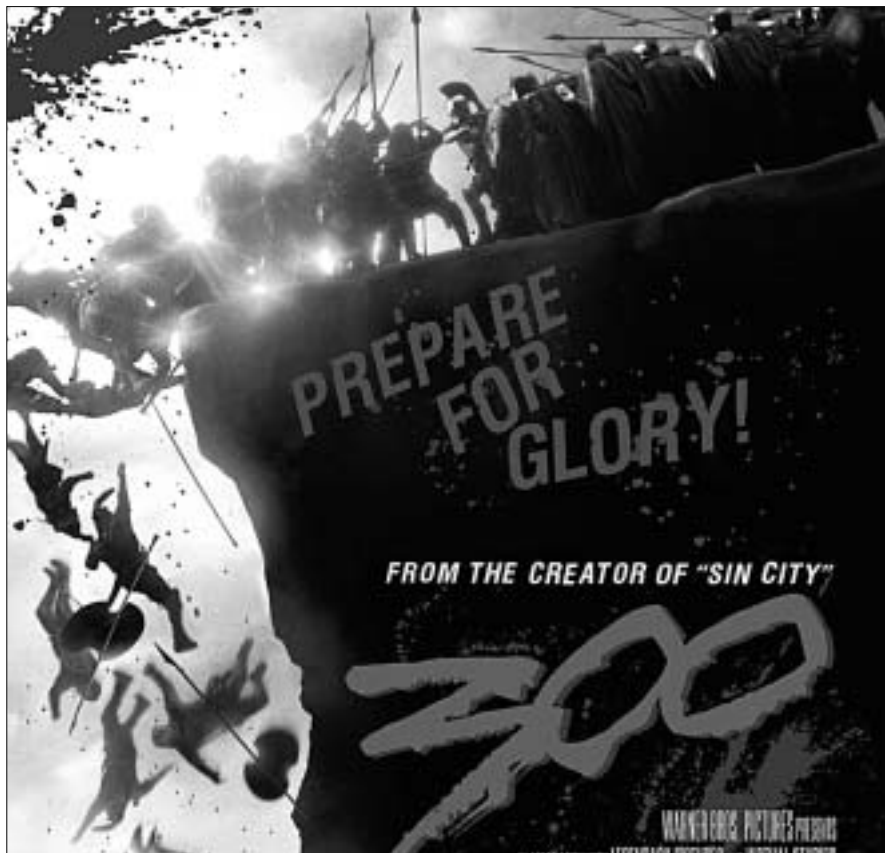
Fragmento del cartel del filme '300', ambientado en la batalla de Las Termópilas

El paso rápido del mundo civilizado al bárbaro, de la anécdota al comentario político, y de aquí a la anotación de costumbres exóticas: tal es el tejido que sirve de fondo a una serie de reflexiones sobre el sentido de las guerras médicas, punto nodal de la historia a lo largo de los siglos. La libertad del ágora griega frente a la tiranía del palacio persa. Sólo así se entiende el tono de desdén con el que Ciro el Grande responde a un tal Lacrines, que había sido enviado para advertirle de sus veleidades expansionistas. Escribe Heródoto que dijo Ciro: "Jamás he temido a este tipo de hombre que, en medio de sus ciudades, tienen un lugar a propósito (el ágora) para reunirse y enganarse unos a otros con sus juramentos. Si yo gozo de salud, esos individuos no tendrán como tema de sus conversaciones las desgracias de los jonios, sino las suyas propias" (Libro I). Por momentos, el avance de los persas parece uno más de los clásicos movimientos de los imperios del Oriente Próximo, en analogía a lo que hicieron primero los asirios, luego los hititas y finalmente los propios medos. Pero, visto más de cerca, el asunto es bien diferente. Por de pronto Ciro ha liberado al pueblo judío, que le considera un hombre de Dios, y le ha devuelto a su país de origen, a Israel con todas las garantías de que podrán reanudar su milenaria historia en una tierra en disputa entre "colonias" helénizadas de palestinos y nómadas árabes. Los episodios se suceden casi sin parar, co-