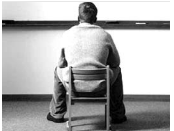
Portada de 'El libro de los fracasos heroicos'.