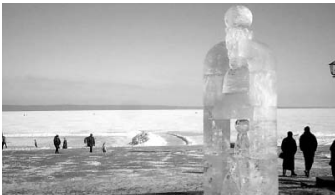
Estatuas de hielo en Petrozavodsk con el lago Onega helado de fondo.

tora hace toda una reflexión, tal y como ella ha señalado en alguna entrevista, acerca de la oposición entre el individuo y el Estado: «La idea de Stalin consistía en convertir al hombre en el "tornillo de la máquina estatal". El Estado invierte todos los esfuerzos en hacer de la persona este "tornillo" y sólo la familia representa el mecanismo que mantiene la individualidad y protege del igualitarismo». Así es, los personajes de esta historia, viven en un mundo aparte, al que naturalmente les condiciona la situación política del país en el que viven, pero que son capaces de crear su propio espacio,