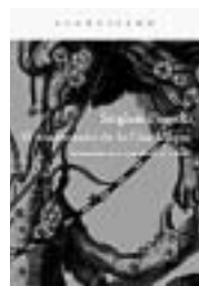
Título: 'El enamorado de la Osa Mayor'. Autor: Sergiusz Piasecki. Traducción de J. Slawomirski y Al Rubió. Editorial: Acanalado.