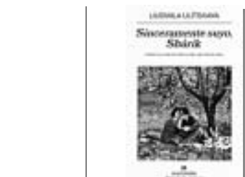
Título: 'Sinceramente suyo', Shúrik'. Autor: Liudmila Ulitskaya. Traducción de Marta Rebón. Editorial: Anagrama.

vés, víctima de mujeres que constantemente requieren sus servicios. Criado por su madre y su abuela, Shúrik no es un ser depravado, ni abusa de las mujeres con las que entabla relación, más bien es un ser incapaz de regir su propia vida y al que el sentimiento de culpa le obliga a ayudar y cuidar de las mujeres con las que se vincula sexual y afectivamente. Liudmila Ulitskaya ha explicado que en parte tardó 17 años en acabar la historia por las dificultades que le planteaba el personaje principal y el rechazo que le generaba su manera de relacionarse con las mujeres. Sin embargo, el resultado es una novela emotiva y llena de matices en la que el personaje lejos de resultar desagradable, nos resulta conmovedor y tierno. Por encima de todo, en el lector queda patente que en Sinceramente suyo, Shúrik la au-