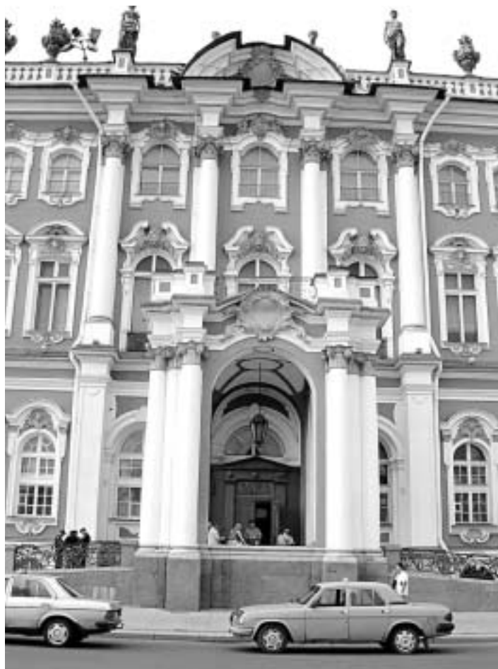
Fachada de un palacio ruso.

El curso editorial, permite también, recuperar éxitos literarios ya olvidados como 'El enamorado de la Osa Mayor', del polaco Serigiusz Piasecki, que ha vuelto a publicarse nuevamente en España. Yuri Andrujovich es un escritor mordaz, con un gran sentido irónico y crítico con la sociedad y el tiempo que vive. Los textos recogidos en 'El último territorio', van desde un hermoso, melancólico y sutil tono poético hasta una penetrante prosa con la que expone crudamente sus sentimientos e inteligentes ob-