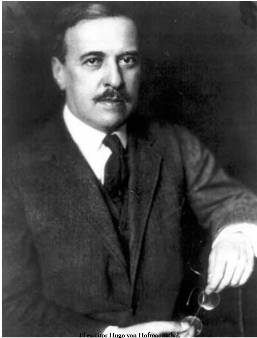
El escritor Hugo von Hofmannsthal.

cualquier época y circunstancia—, un espacio, en definitiva, hecho de contrarios, al que la expresión acuñada para definir el clima cultural de la Viena de entresiglos, «revolución conservadora», encaja tan bien como un zapato de cristal, extravagante y quebradizo. No en vano sostiene Magris que la opción de Hofmannsthal ante aquel mundo en declive fue «la evasión rumbo a un lujurante, sutil y sensual esteticismo», en lugar de intentar emplear su escritura para desviar el fatal curso de los acontecimientos. De hecho, en ocasiones incluso lo habría alimentado, como vendría a demostrar el nacionalismo militarista de sus artículos de la primera guerra, tan olvidados en su caso como en tantos otros. No es poco el empeño que pone el editor de Asomado al abismo en desdibujar esta imagen y en hacer aparecer a Hofmannsthal como un escritor engastado en su tiempo, casi se diría en