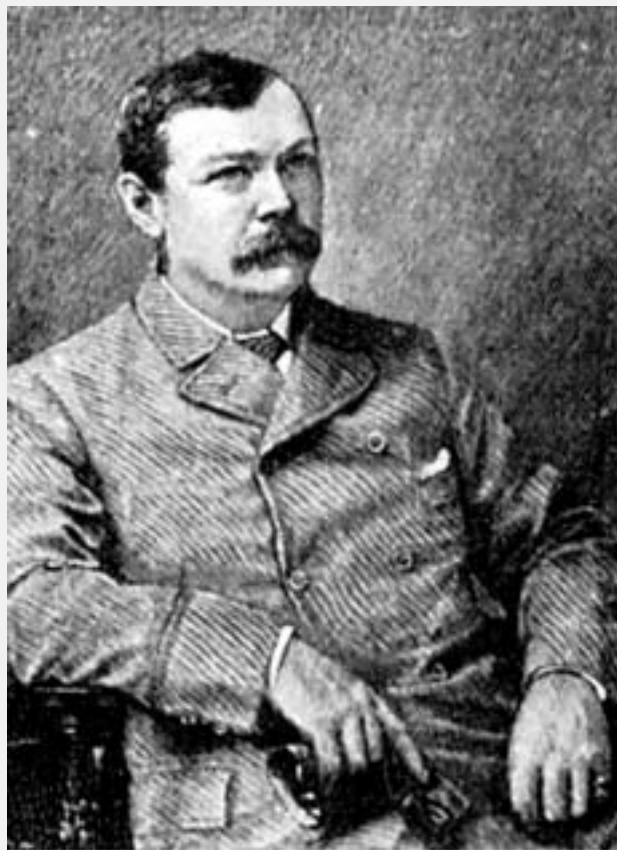
Arthur Conan Doyle, uno de los protagonistas de la novela.

Además, 'Arthur & George' ofrece no sólo una novela de detectives basada en hechos reales, sino también una novela psicológica brillante que ha devuelto a la vida 'literaria' la intrincada personalidad del autor