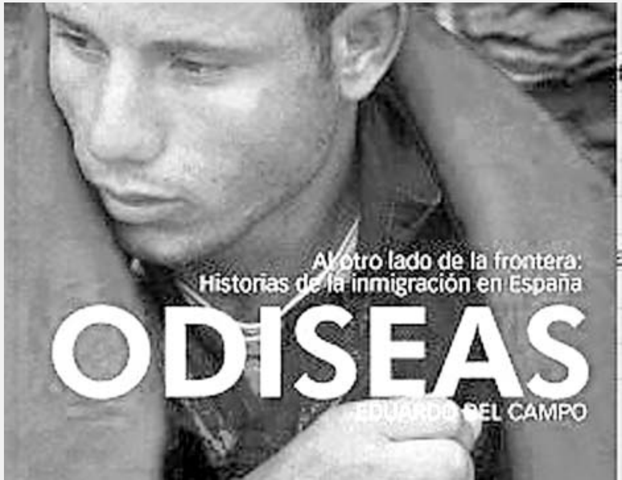
Portada del libro 'Odiseas'.

'Odiseas' levanta un testimonio real y humano que golpea la conciencia y desvela la hipocresía social