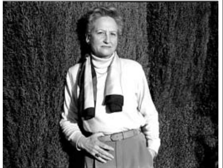
La escritora granadina Rosaura Álvarez.