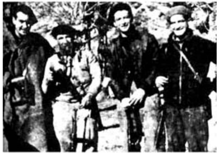
Grupo guerrillero republicano activo en 1938 en la provincia de Granada.