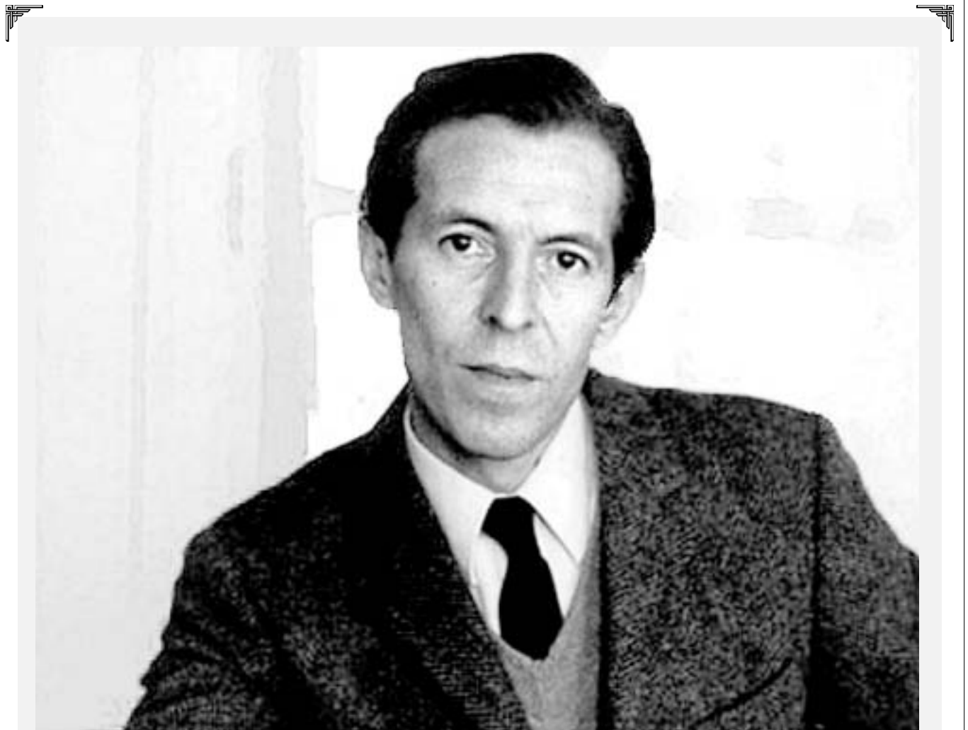
Julio Ramón Ribeyro.

cológica en el siglo XIX. El período en el que este género privado fue muy practicado y dado a conocer por los viajeros románticos que levantaban actas e impresiones de sus viajes, impregnándolos de una mirada literaria que se transformaría en género en 1830 con los cuadernos de Byron y de Vigny y sobre todo en 1845, cuando se hizo célebre el 'journal' de Maine de Biran aparecido en prensa. El precedente más conocido del género y que propició que, en 1890, el diario fuese oficialmente declarado género literario con la publicación del diario de Henri Frédéric Amiel. A partir de esa fecha proliferarían estos reportajes de la conciencia donde los escritores ponían a prueba formas inéditas de percibir y sentir las cosas, además de utilizarlos como un cuaderno de notas que, más tarde, servirían para elaborar una novela.